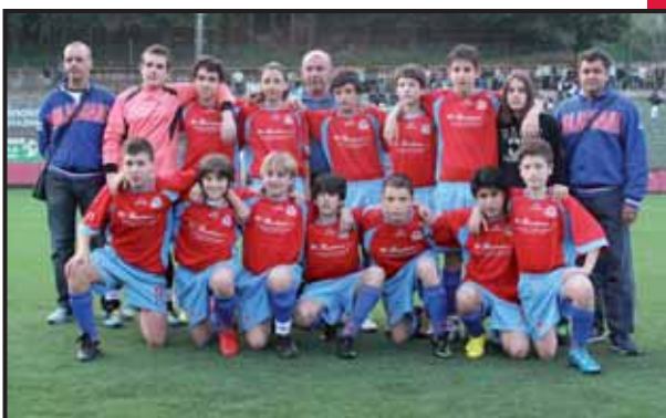
A.S.D. Molassana Boero 1918 - Genova