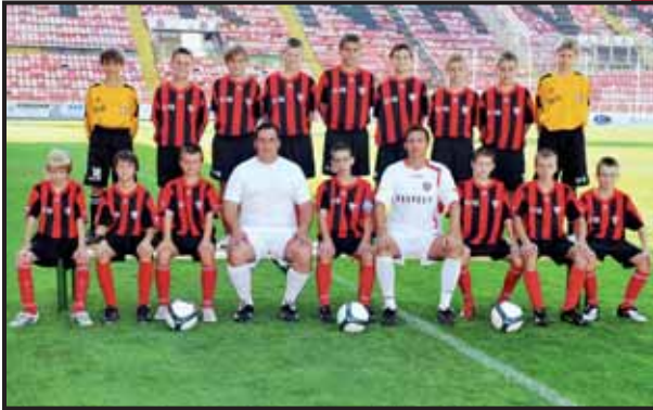
F.C. Spartak Trnava - Slovacchia