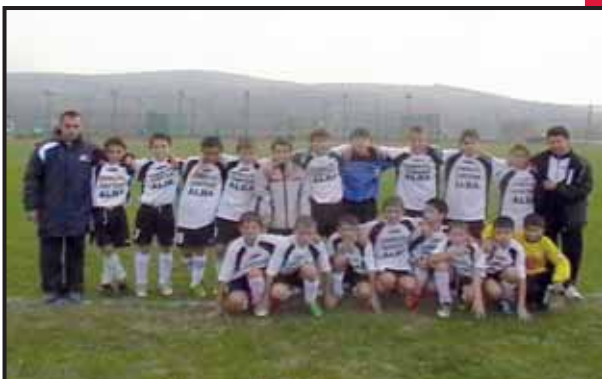
Clubul Sportiv Temerarul - Romania