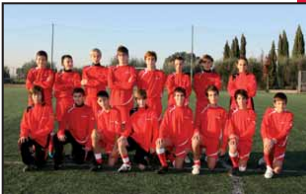
A.S.D. Lodigiani 2005 - Roma