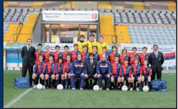
Genoa C.F.C. Spa leva 1997 - Genova