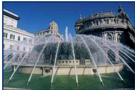
conc. PHOTO SHOP-Via Cecchi 911-GE

Assessore allo Sport della Regione Liguria