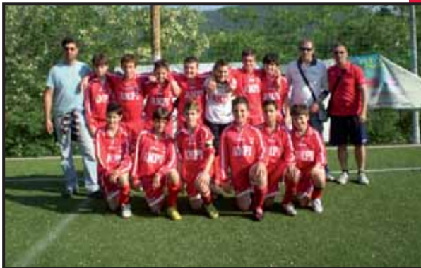
A.S.D. ANPI Sport Casassa - Genova