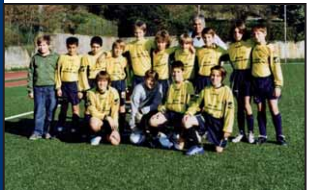
A.S.D. Vecchio Levante - Levanto