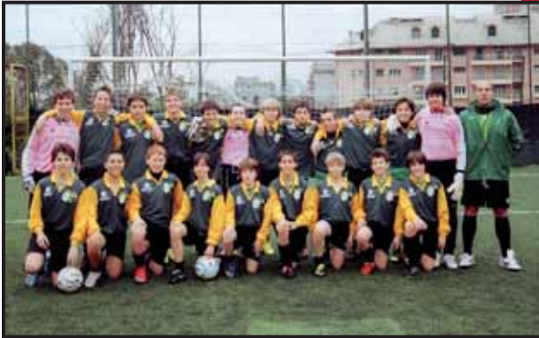
A.S.D. Athletic Club Genova - Genova