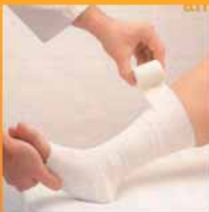
Bende e prodotti antisanguinamento