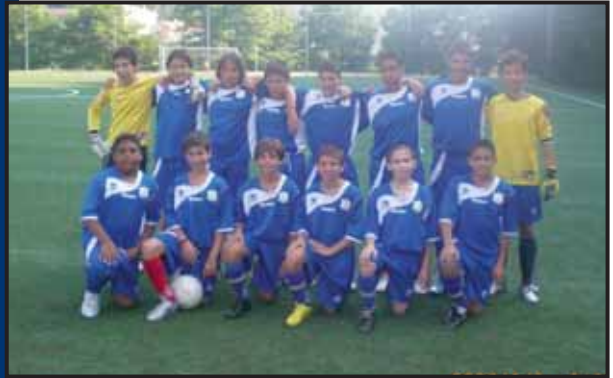
A.S.D. Genovese Calcio - Genova