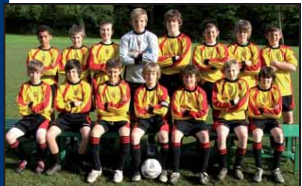
Mumbles Rangers - Galles