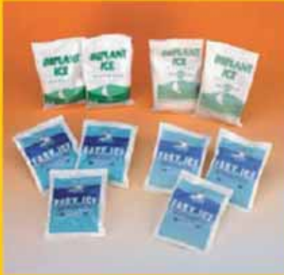
Ghiaccio in buste