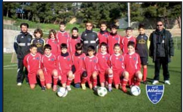
A.C.D. Atletico Bosa - Sardegna