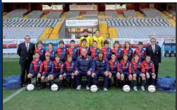
Genoa C.F.C. Spa leva 1998 - Genova