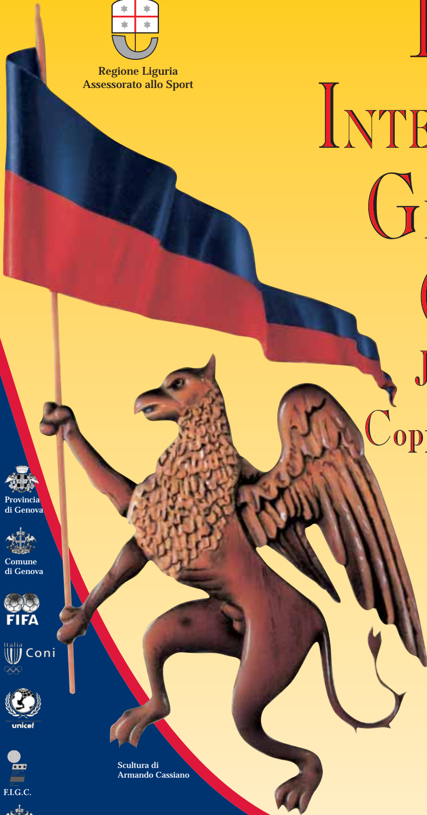
Scultura di Armando Cassiano