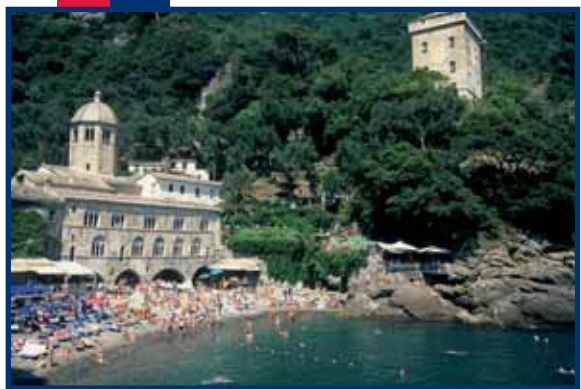
conc. PHOTO SHOP - Via Cecchi 91r-GE